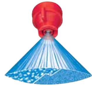
Bei 1 bar (15 PSI) Druck Bei 4 bar (60 PSI) Druck